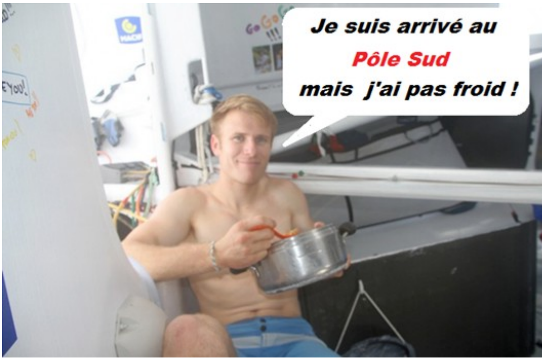
Photo : François Gabart le vainqueur de l'édition Vendée Globe 2012 ... en tenue de neige !