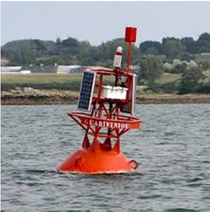
Photo : une porte flottante qui émet des signaux de guidage aux Skipper du Vendée Globe

Nous nous pensons que ces portes servent plutôt à tricher sur le parcours réel de cette course qui semble un tout autre parcours qui expliqueraient finalement l'origine de toutes ces incohérences et anomalies (en terme de durée de la traversée en jours et en kilomètre parcourus ) qui semble s'allonger et se raccourcir chaque année au grès du vent des Globe.