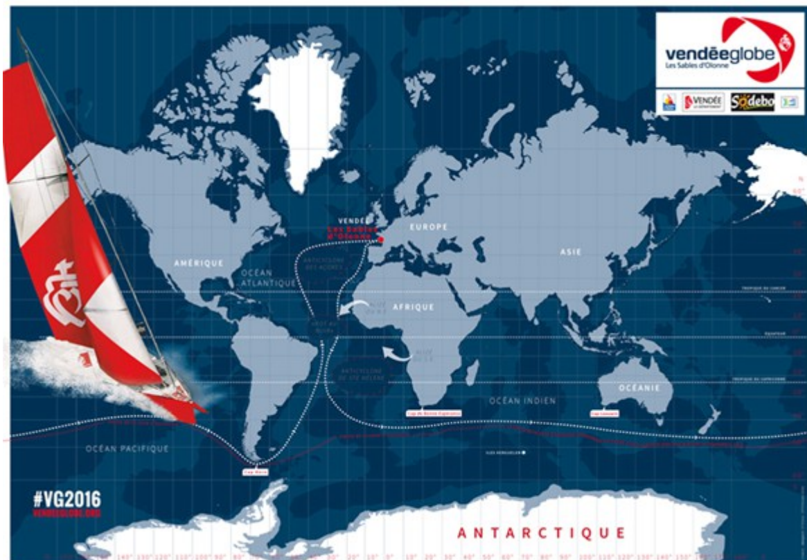
Photo : Le nouveau parcours du Vend des Globes édition 2016...et qui s'éloigne du Pôle Sud ! ???

Un article paru le 03.11.2016 sur le journal « Le Monde » signé par la journaliste Véronique Malécot , nous explique toute cette affaire :