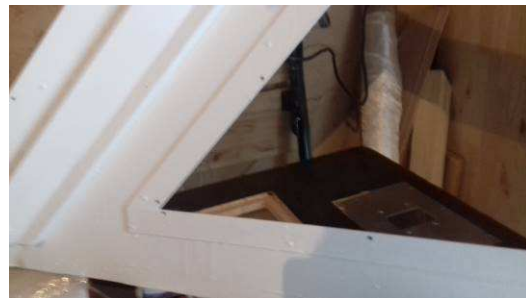
Mise en place des plexis et installation sur le bateau