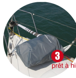
3 prêt à hisser