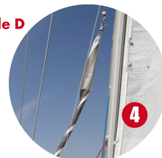
4 hisser depuis le mât