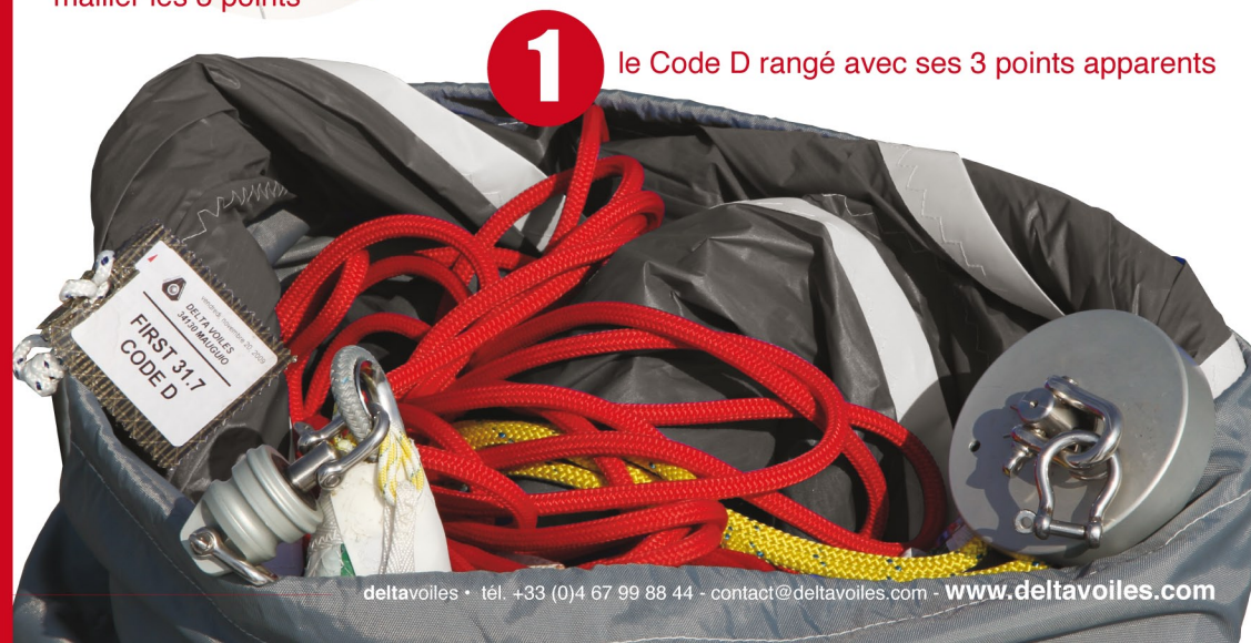
1 le Code D rangé avec ses 3 points apparents