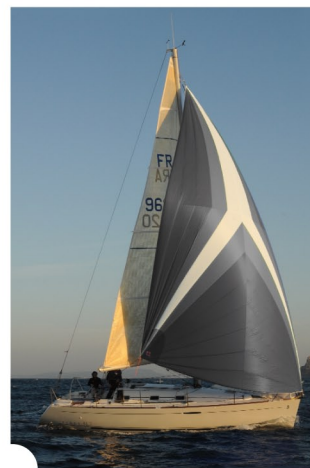
au plus haut à 60° du vent apparent