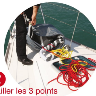
2 mailler les 3 points

mailler, hisser, dérouler, simple comme un Code D