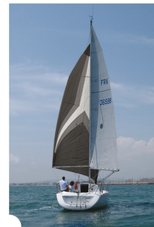
plein vent arrière, tangonné au vent

mailler, hisser, dérouler, simple comme un Code D