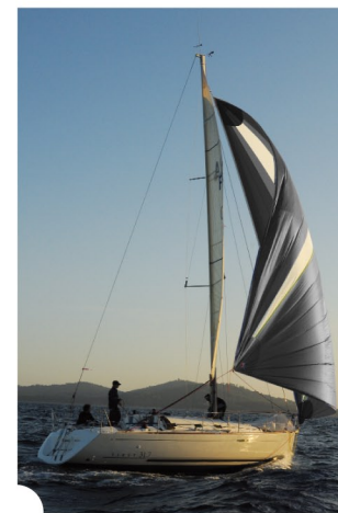
au plus bas à 140° du vent apparent