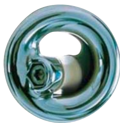
Facilite la prise de ris

P18792 Oeillet Ø 35 mm, par 2..... 67,20 € Pour cordage max 12 mm