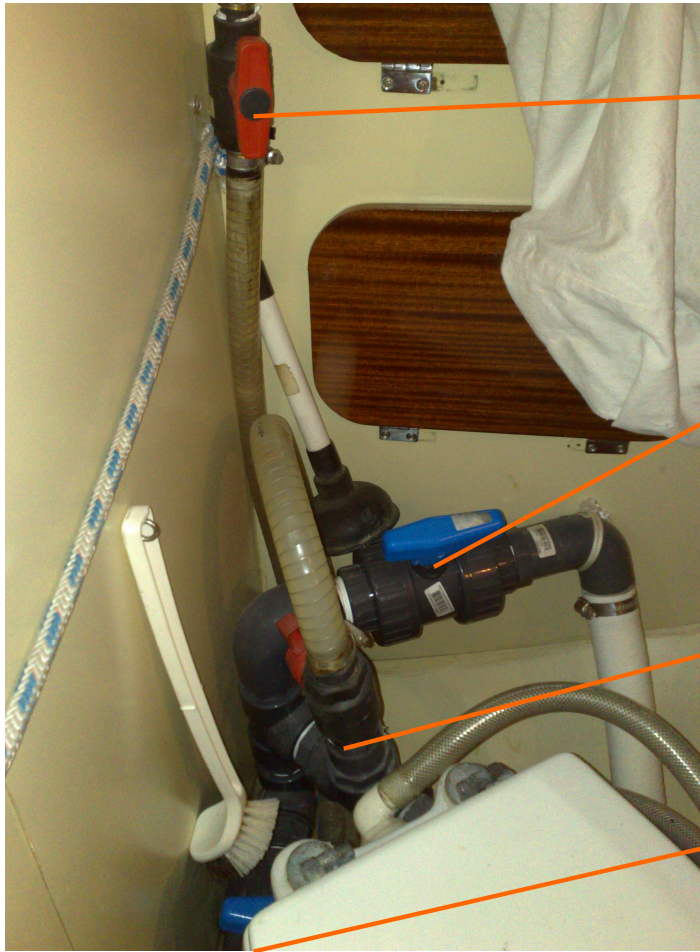
Vanne (6): event