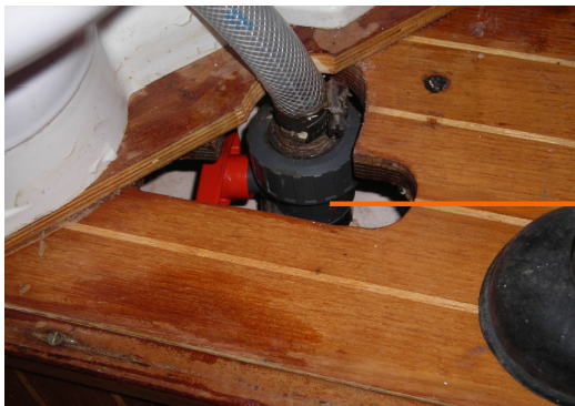
Vanne (5) (arrivee eau de mer) : sous WC vers l'avant