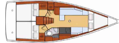
Cruiser - 2 cabines