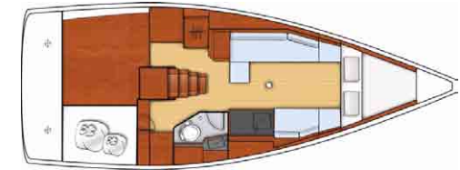
Week Ender - Transformable 2 cabines