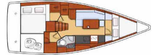
Cruiser - 3 cabines